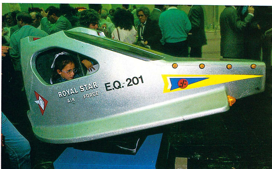
«Space Comander», simulador de vuelo infantil.

Con treinta presentaciones en cinco días