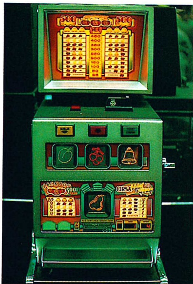
La «Mini Guay» con sombrero incorporado.