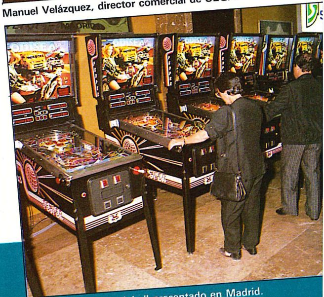
«Odisea» el nuevo pinball presentado en Madrid.