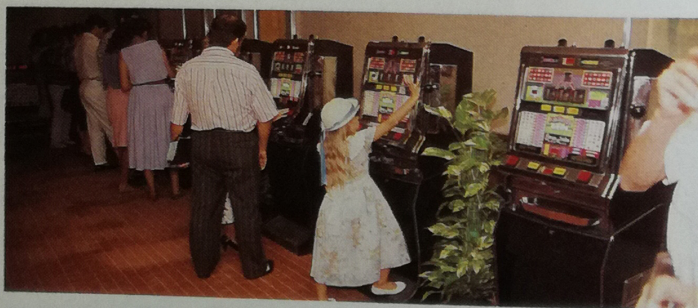
Una imagen insólita que sólo puede, y debe, presenciarse en las presentaciones, cuando no existe dinero en juego. Una niña de corta edad se sintió atraída por la voz de la «Bingo-Belle»

● «Todavía tenemos que vender muchas, muchas, muchas...»